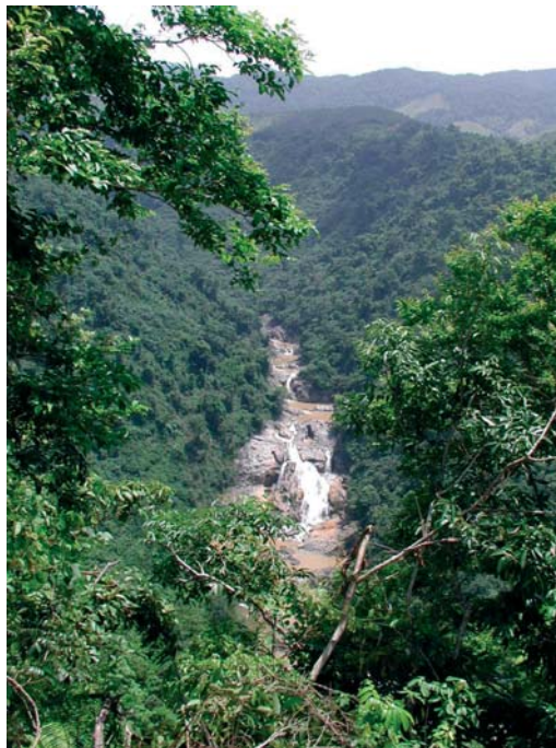
Blick auf den Rao Quan Fluss vom Druckleitungstrasse aus View from Penstock down to Rao Quan River

The geology of the project site is rather complex and difficult to explore because the original bedrock has been capped by an extensive basalt flow forming a wide plateau. The basalt layer is weathered, fractured and decomposed to residual soil at its base. The underlying older bedrock consists of weakly cemented mudstones, metamorphosed schists and granitic or andesitic intrusions. The subsoil conditions have been investigated by seismic and geoelectric methods and a large number of core drillings.