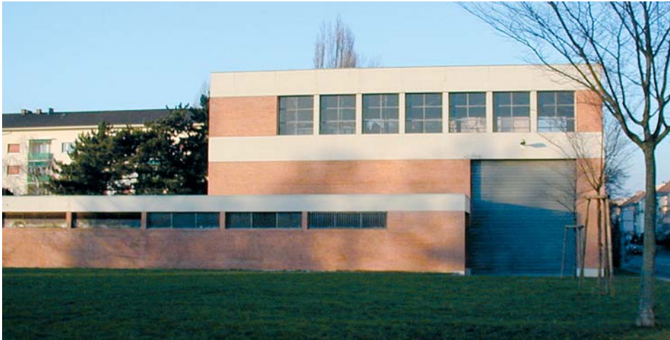
Ansicht Unterwerk Wasgenring, oberirdische Montagehalle

All auxiliary systems for energy supply of the switchgear (including rectifiers, batteries and inverters) and for air conditioning will also be renewed. The building will be ecologically