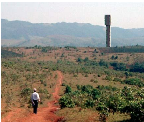
Fotomontage von geplante Wassersturmturm Photomontage of proposed surge tank tower

er Authority EVN. This company, with about 1'000 employees, is responsible for the planning of all EVN's hydropower plants in northern and central Vietnam.