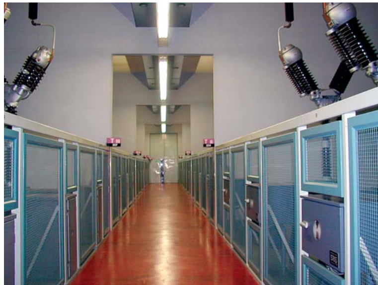
Luftisolierte Schaltanlage von 1962 für 150kV Air insulated switchgear for 150kV, from 1962

The retrofit concept is based on a complete shutdown during construction. This allows all systems to be completely replaced